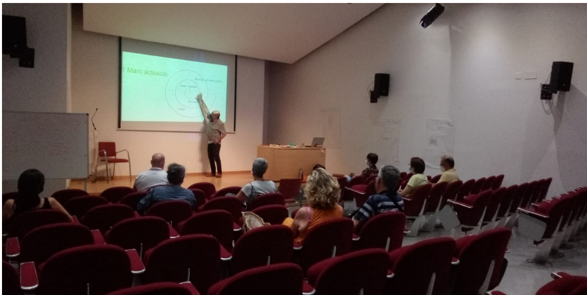
Sessió amb les entitats de la Taula de la Solidaritat. 15 Juny 2021. Molí dels Frares

Aquestes propostes han estat relatades en el marc d'entrevistes a les entitats i serveis, una jornada participativa i presencial amb les entitats de la Taula i una revisió posterior per part d'aquestes.