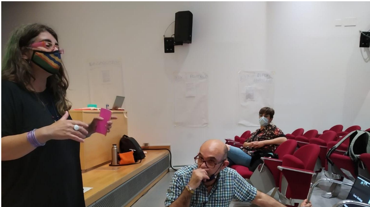
Sessió amb les entitats de la Taula de la Solidaritat. 15 Juny 2021. Molí dels Frares