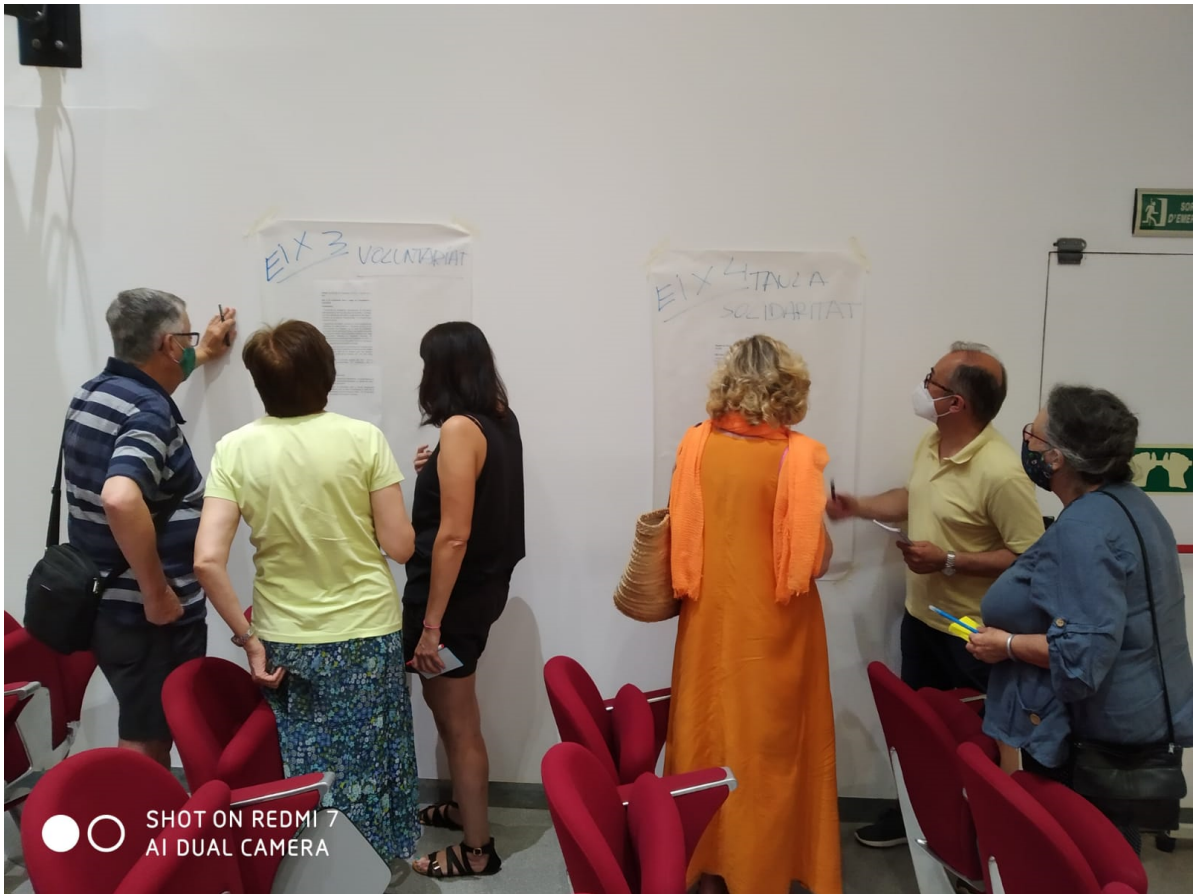
Sessió amb les entitats de la Taula de la Solidaritat. 15 Juny 2021. Molí dels Frares